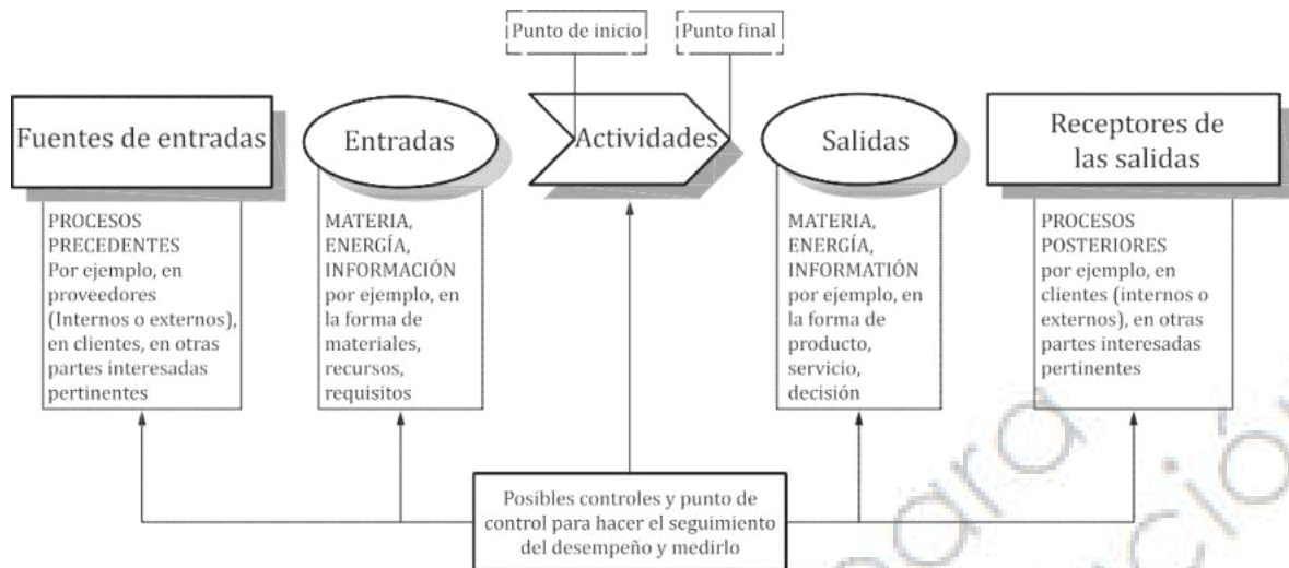
Figura 1 — Representación esquemática de los elementos de un proceso